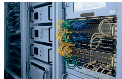
INTUS ACM8e Rack mit Patch-Panel

Die Zutrittskontrollmanager besitzen Alarmschnittstellen bei Vandalismus und ein Interface für Einbruchmeldeanlagen. Zahlreiche integrierte Testfunktionen vereinfachen die Installation und sorgen für kurze Service- und Wartungszeiten. Alle Eingänge sind individuell opto-entkoppelt. Selbst beim Ausfall eines Lesers durch Überspannung auf der Zuleitung arbeiten alle anderen Leser weiter. Die Zutrittsmanager von PCS: außergewöhnlich zuverlässig – hoch sicher – super schnell. So geht Zutrittskontrolle.