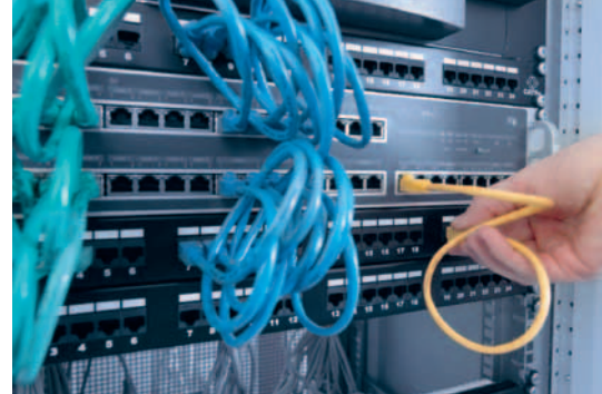
INTUS ACM8e Rack mit Patch-Panel

Der Zutrittskontrollmanager: Schaltzentrale eines Zutrittskontrollsystems, ausgestattet mit einem leistungsfähigen Rechner, eingebunden in ein Sicherheitssystem mit dezentral verteilter Intelligenz. Von einem zentralen Leitreechner mit variierenden Stammdaten versorgt, trifft der Zutrittskontrollmanager im Rahmen der definierten Raum- und Zeitprofile die Entscheidung, ob eine Tür geöffnet werden darf oder nicht. Selbst beim Ausfall des Netzwerkes zum Leitreechner steuert er zuverlässig die angeschlossenen Zutrittsleser, die Türen mit ihren Überwachungskontakten, die Schranken, Drehsperrern oder die angeschlossene Videoaufzeichnung. Dezentrale Intelligenz für hohe Ausfallsicherheit – zu Ihrer Sicherheit.