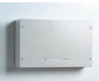
INTUS ACM8e Wand